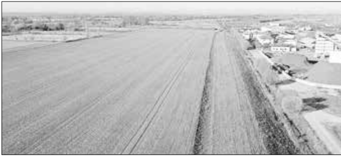
Bereits umgesetzter Bauabschnitt 1.1