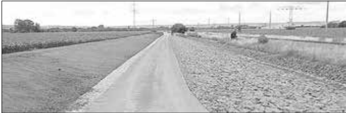
Bereits umgesetzter Bauabschnitt 1.1 mit Überströmstrecke