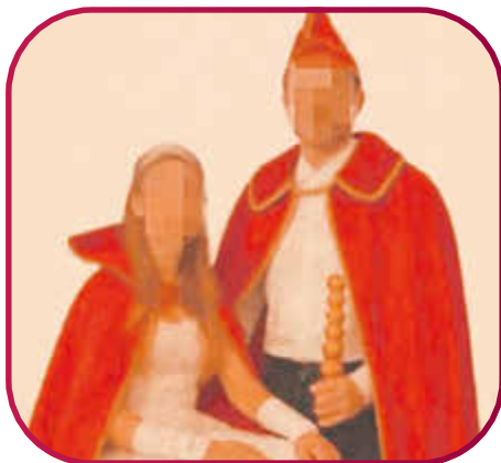
Prinzenpaar des 1. EKC „Hier könnte dein Name stehen ...“ Wir freuen uns auf euch.