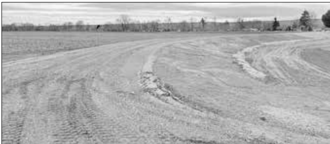
Bereits umgesetzter Bauabschnitt 1.4