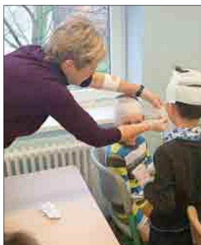
Gefährlich aussehend, aber immer mit einem Lachen im Gesicht, wirkt das Klassenfoto „Heldhaft“.

Die Klasse 3a der Grundschule Walschleben hatte Besuch von einem ehrenamtlichen Mitglied des DRK. Auf spielerische und spannende Weise wurde das Thema - Erste Hilfe - besprochen. Die Kinder malten eine Hand aufs Papier, womit man die 5 wichtigen Fragen beim Notruf nicht vergisst. Natürlich kam die Praxis dabei nicht zu kurz. Beim Anlegen der Verbände hielt es dann keinen Schüler mehr auf seinem Sitzplatz aus. Kaum zu glauben, wie viel Verbandsmaterial um ein Kind passt!