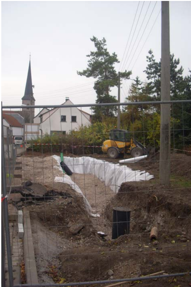
Herstellung der Versickerungsrigole im Platzbereich Einmündung Untertor