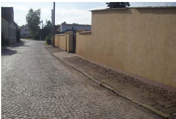
Thomas-Müntzer-Straße mit Blick zur einmündung Untertor