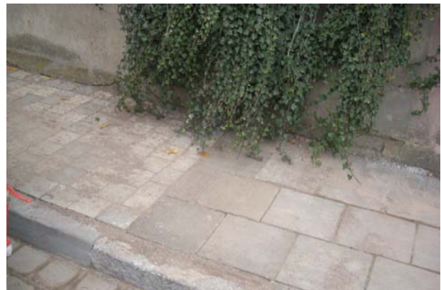
Bauende des Gehweges mit Anpassung zum nächsten Bauabschnitt