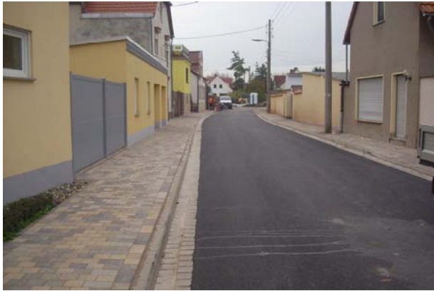
Blick vom Platz der Befreiung in die Thomas-Müntzer-Straße