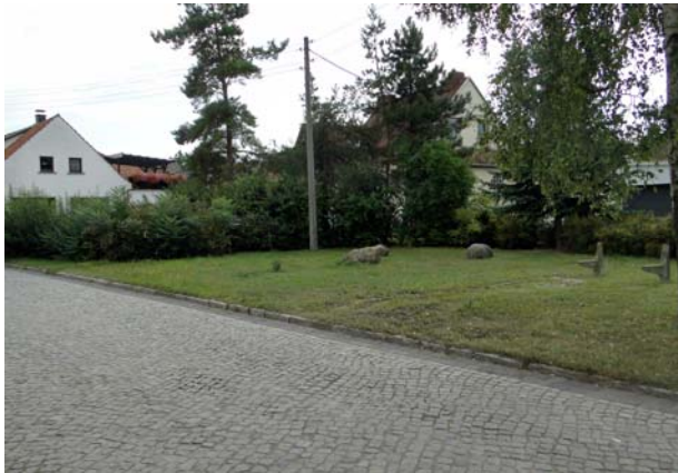
Grünfläche Bereich Einmündung Untertor