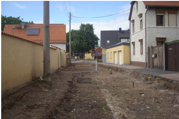
Rückbau der alten Fahrbahn