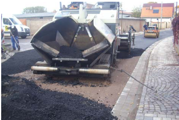
Asphalteinbau Bereich Einmündung Untertor