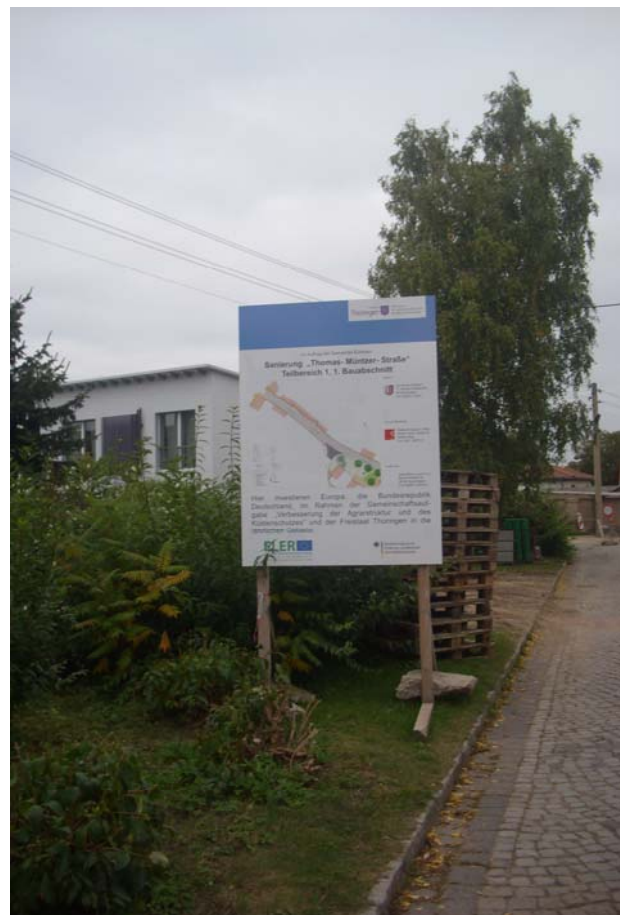
Bauschild im Bereich der geplanten Grünfläche