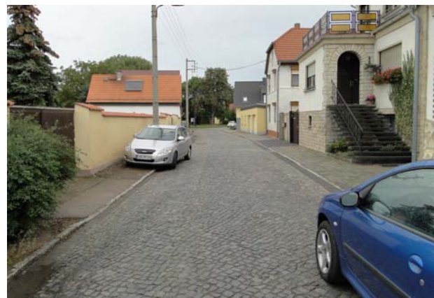
Thomas-Müntzer-Straße mit Blick zum Platz der Befreiung