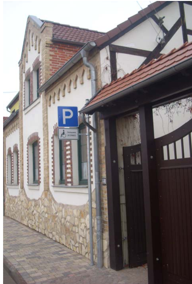
Errichtung eines Behindertenparkplatzes