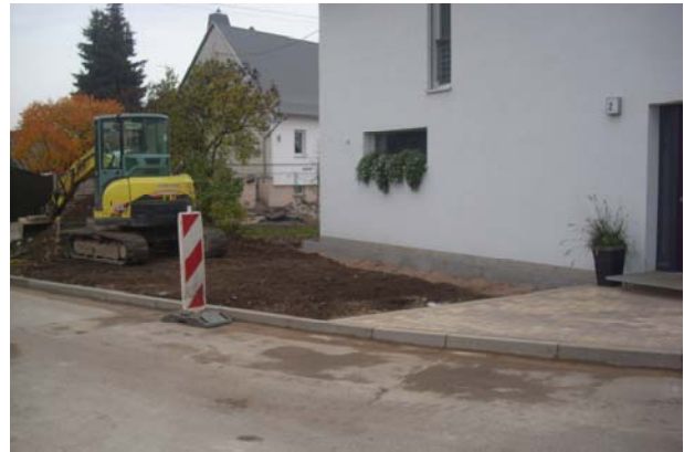
Grünfläche über der Rigole unmittelbar vor Fertigstellung