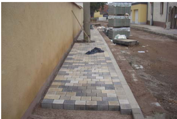
Pflasterung der Gehwege