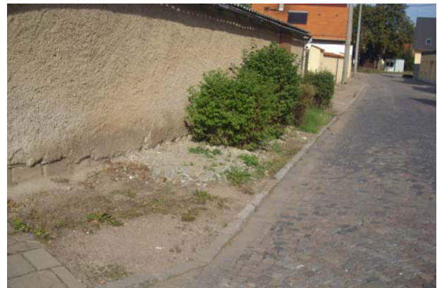
Unbefestigter Randbereich der Thomas- Müntzer- Straße