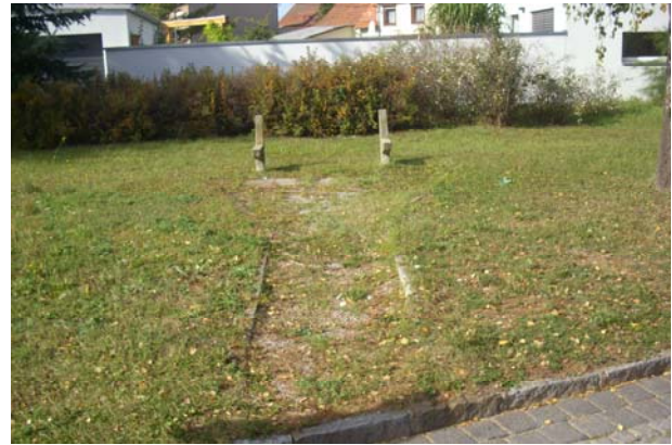
Grünfläche mit desolater Sitzgruppe