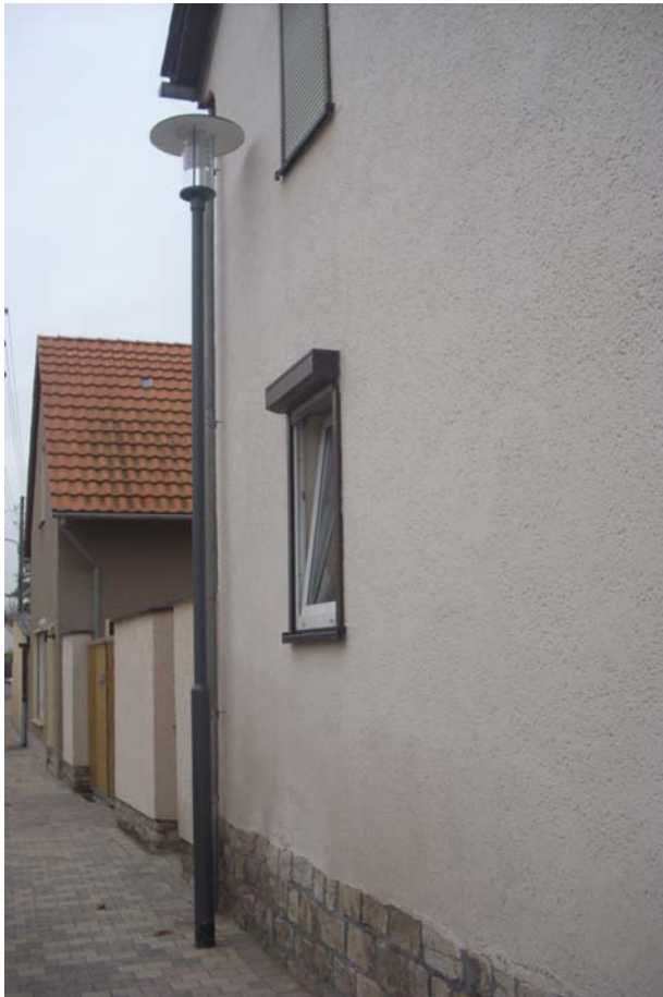
Neuer Lichtpunkt der Ortsbeleuchtung