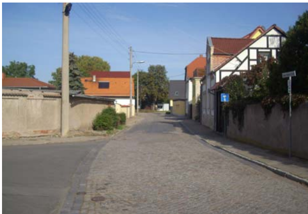
Einmündung Untertor / Thomas- Müntzer Straße