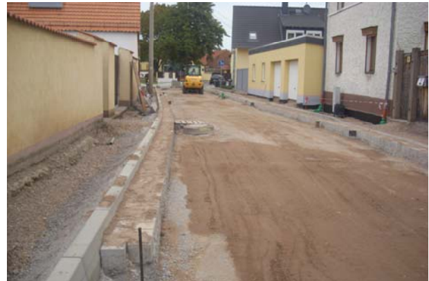
Einbau Bordanlage mit Betonrinne und Frostschutzeinbau