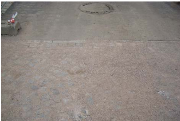
Bauende der Fahrbahn mit Anpassung zum nächsten Bauabschnitt