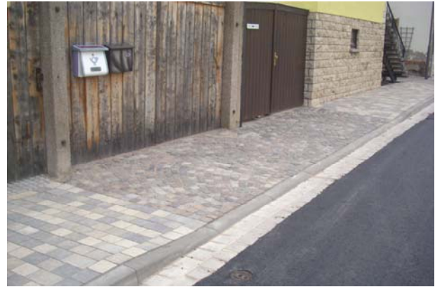
Neugestaltung der Grundstückszufahrten in Natursteinpflaster